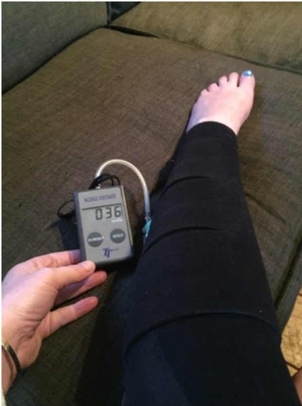
Rustdruk (been horizontaal)