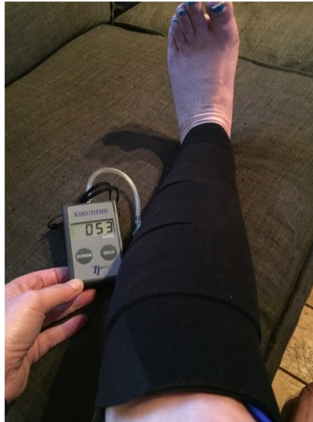
werkdruk (met voet in dorsaal flexie)

Hoe groter het verschil in druk tussen statisch en dynamisch; hoe groter de stiffness (stijfheid) van het verband en hoe sneller het oedeem gereduceerd wordt